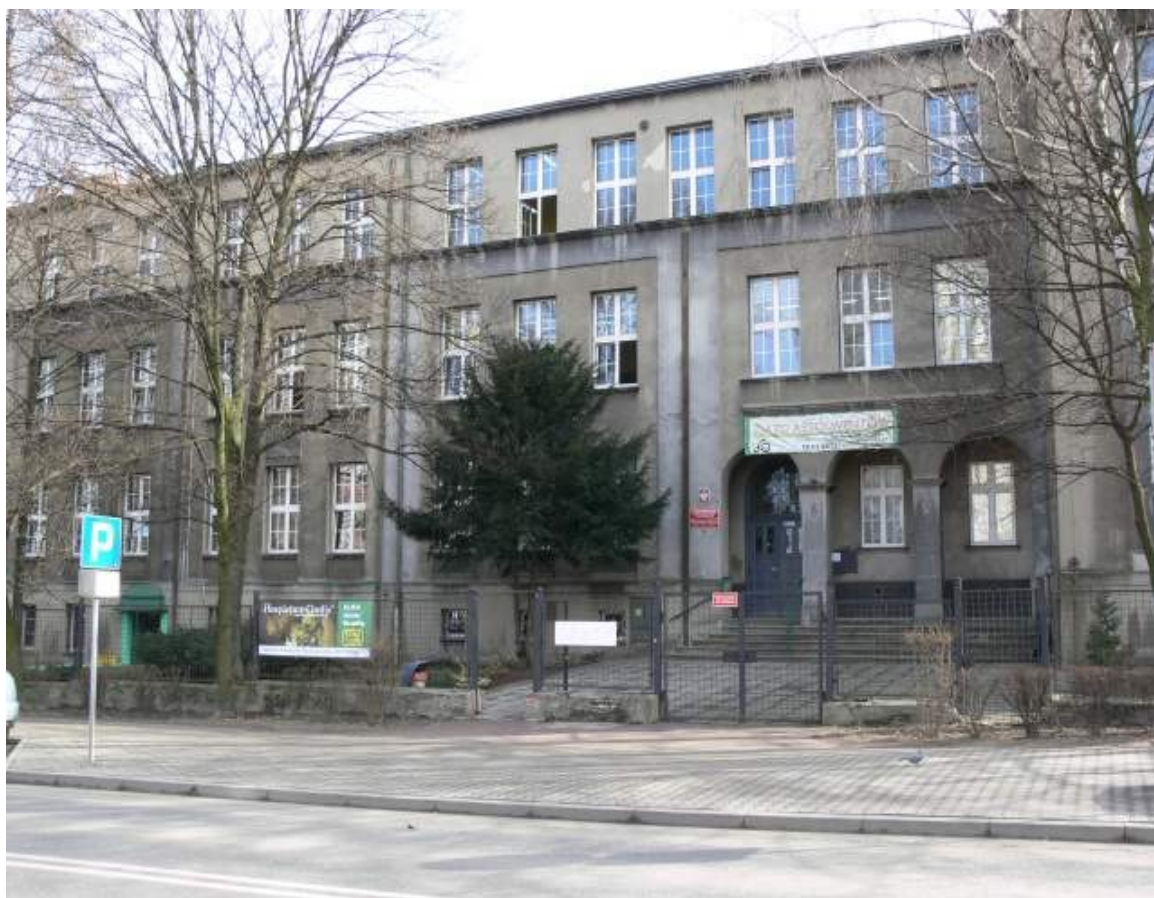
Budynek szkoły powszechnej, obecnie własność Sądu Rejonowego Plac Wolności 3