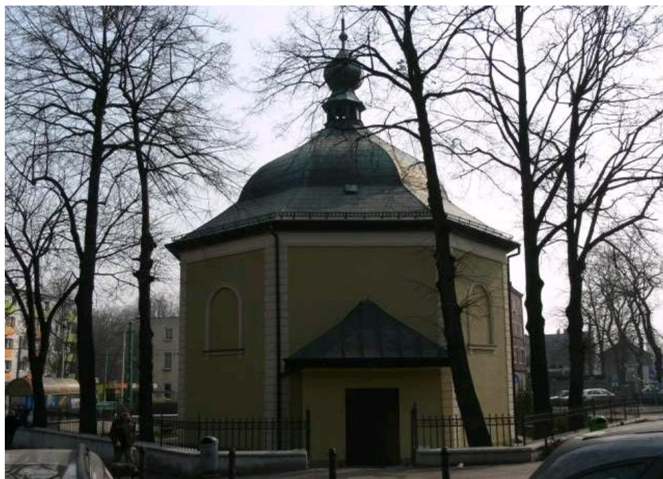
Kościół parafialny p. w. Św. Krzyża ul. Świerczyny, przy nr 1