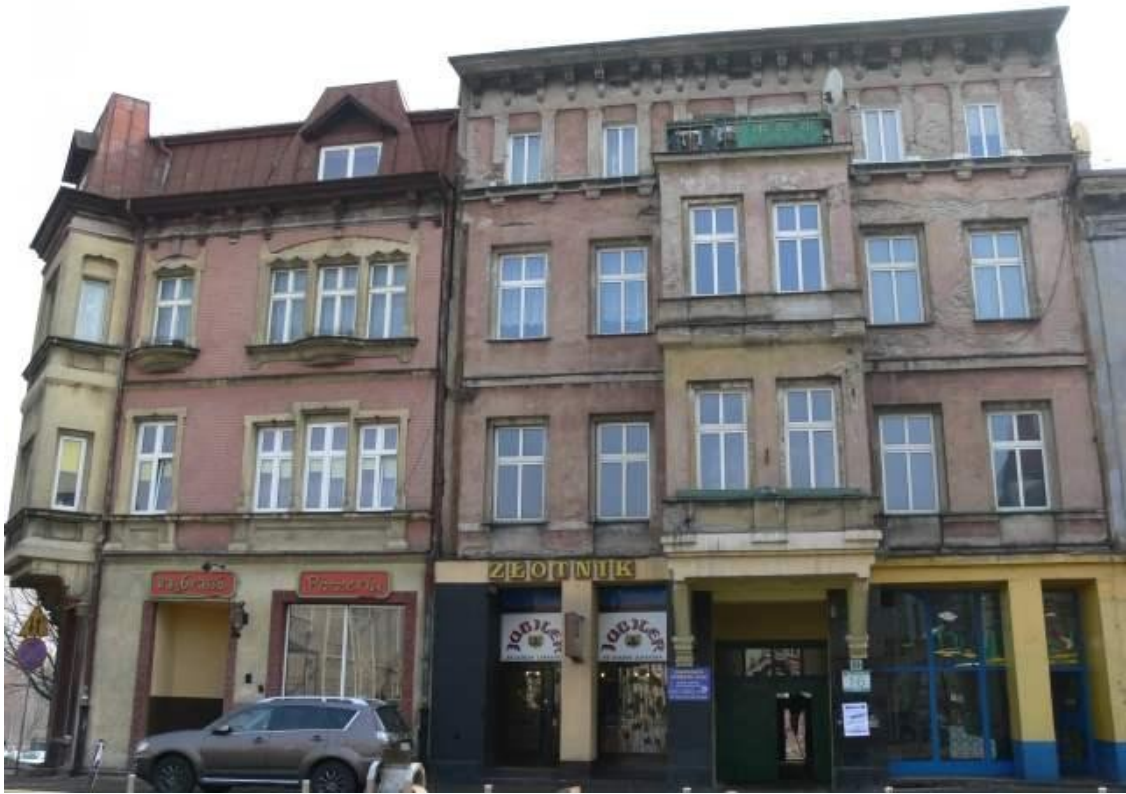
Budynek mieszkalny w stylu historyzmu ul. Wyspiańskiego 3