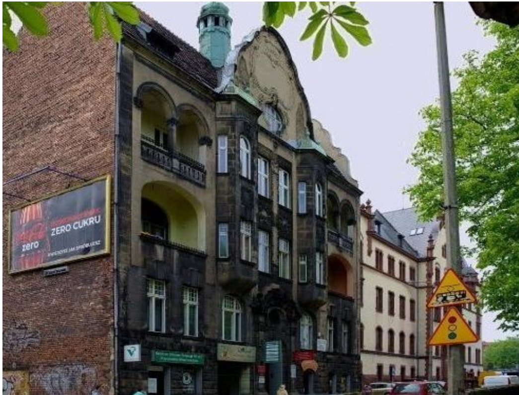
Gmach I Liceum Ogólnokształcącego ul. Mickiewicza 6