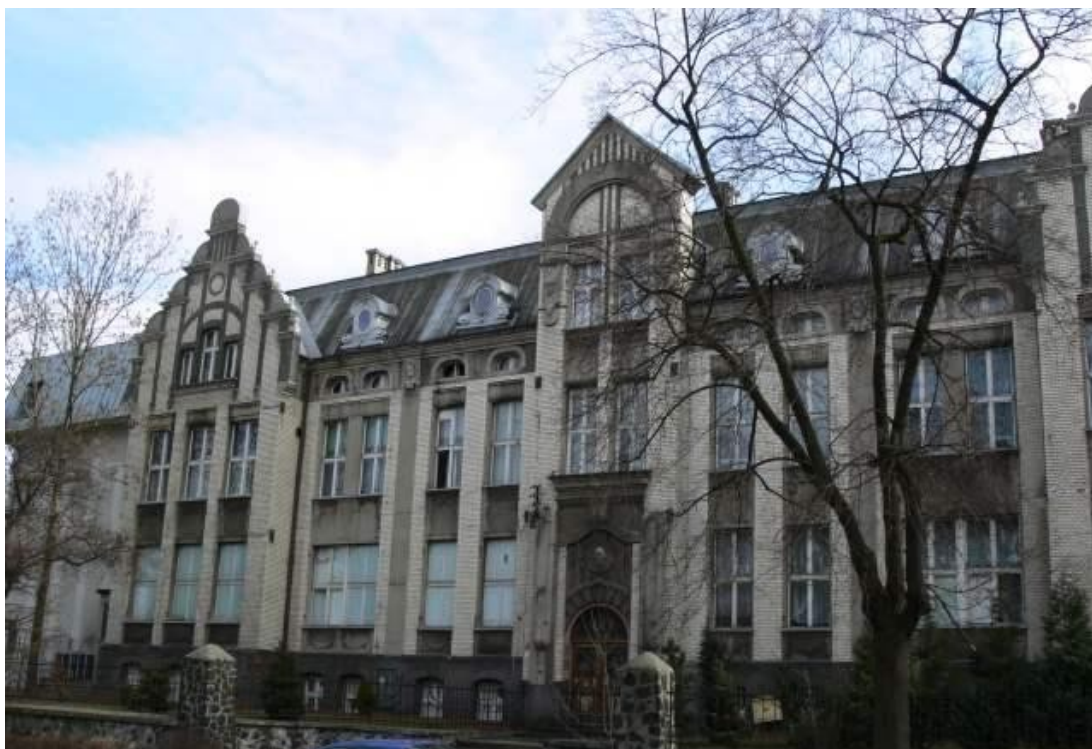
Budynek dawnego Szpitala Brackiego ul. Świerczyny 1