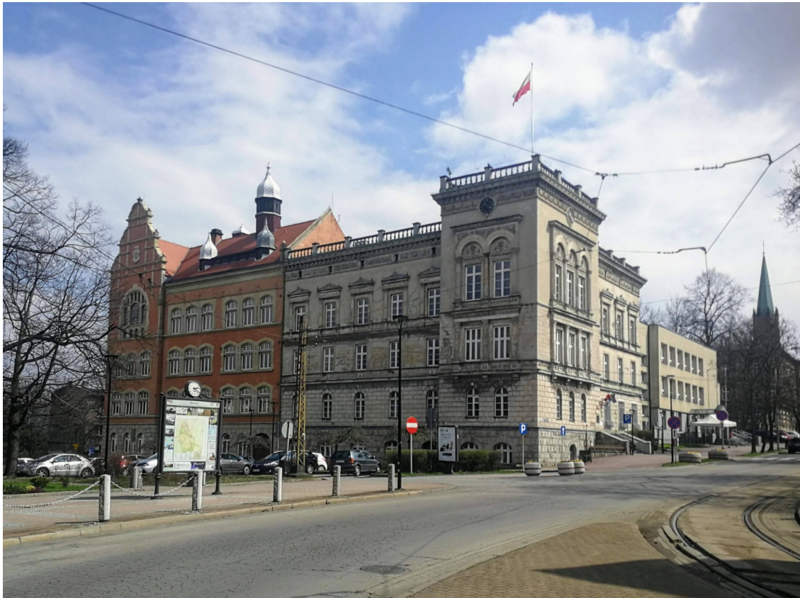
Blok zabudowy mieszkaniowej tzw. Bauverein ul. Mikołowska 26 – 36