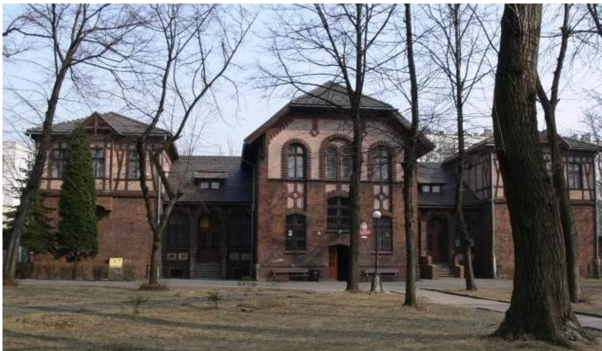
Kościół Ewangelicko – Augsburski Apostołów Piotra i Pawła ul. Powstańców 5